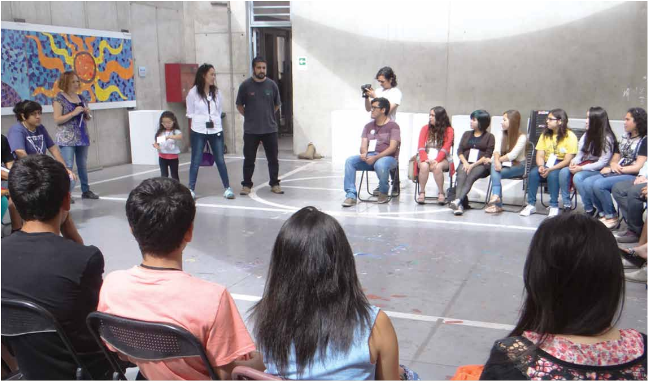
Jóvenes secundarios participaron durante el 2014 de una serie de actividades contempladas en el programa Formación de Liderazgos Sociales, concluyendo este ciclo con el Encuentro Generacional, donde conocieron las experiencias de los integrantes de años anteriores. ▲