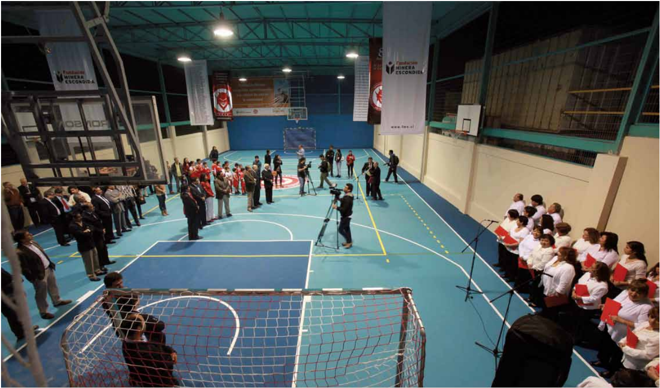
La inauguración de la Multicancha Club Deportivo Ex Alumnos del Liceo de Hombres se convirtió en un gran hito para la comunidad deportiva local, renovando así uno de los recintos histórico de la capital regional. ▲

Así, la Fundación administra el programa Circuito Deportivo, proyecto impulsado por Minera Escondida, invirtiendo más de 5 mil millones de pesos para la remodelación y habilitación de diversos recintos ubicados en distintos puntos estratégicos de la ciudad de Antofagasta.